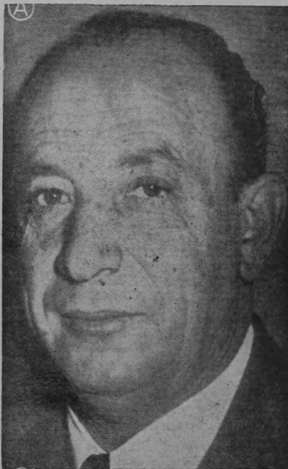
FRANCISCO J. ORLICH

ESTE SERA EL PROXIMO PRESIDENTE DE COSTA RICA, CON SU VOTO Y CON EL VOTO DE TODOS LOS COSTARRICENSES CONS-CIENTES QUE DESEAN PARA SU PATRIA PROGRESO CON LIBER-TAD Y JUSTICIA SOCIAL CON DEMOCRACIA.