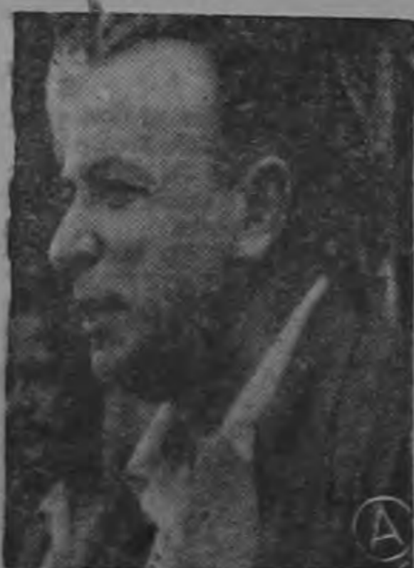
Don Francisco J. Orlich